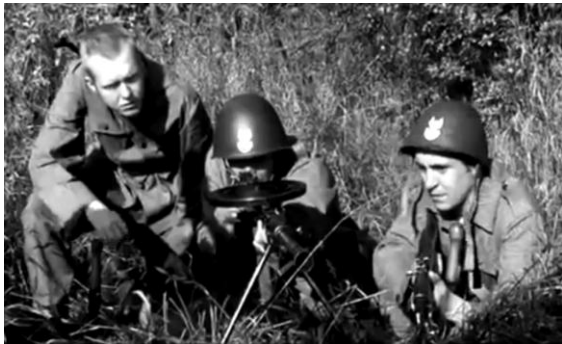
Kadr z filmu „Popieluszko. Wolność jest w nas” – jednostka specjalna dla kleryków, Bartoszyce 1967 r.

ilość powoływanych do wojska alumnów, w szczególności z tzw. „niegrzecznych diecezji” i poddawano tzw. „obróbce” ze strony aparatu politycznego. Tymi działaniami kierował również generał Jaruzelski. Pracował z właściwą sobie gorliwością. Szkolił podległy aparat w propagandzie ateistycznej, wydawał kolejne wytyczne nasilające system represji.