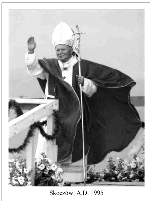
Skoczów, A.D. 1995

„(...) Być człowiekiem sumienia, to znaczy przede wszystkim w każdej sytuacji swojego sumienia słuchać i jego głosu w sobie nie zagłuszać, choć jest on nieraz trudny i wymagający; to znaczy angażować się w dobro i pomnażać je w sobie i wokół siebie, a także nie godzić się nigdy na zło, w myśl słów św. Pawła: «Nie daj się zwyciężyć złu, ale zło dobrem zwyciężaj!» (Rz 12, 21). Być człowiekiem sumienia to znaczy wymagać od siebie, podnosić się z własnych upadków, ciągle na nowo się nawracać. Być człowiekiem sumienia, to znaczy angażować się w budowanie królestwa Bożego: królestwa prawdy i życia, sprawiedliwości, miłości i pokoju,